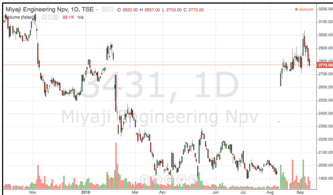
Gráfico en bolsa de Miyaji Engineering del último año.

En julio compramos acciones de Miyaji Engineering [TYO: 3431] , una empresa especializada en la construcción de puentes e infraestructuras. Lo más sorprendente fue descubrir que la acción cayó en bolsa de los 3.100 yenes/acción de nov-17 a los 1.900 de este verano, mientras sus pedidos firmados de nueva obra pública se multiplicaban por cuatro en cuatro años, lo que asegura una gran mejora en sus ventas y beneficios. Tras adquirirla en el entorno de los 2.000 yenes/acción, la empresa publicó resultados muy buenos y mejoró las expectativas, nada extraño viendo sus pedidos. El mercado se tomó muy positivamente la noticia y sus acciones subieron en tres semanas hasta los 3.000 yenes/acción. Miyaji Engineering tiene tan solo en su accionariado un 8% de inversores extranjeros. Su valor en bolsa a finales de septiembre, tras la fuerte alza en sus acciones, era de unos 170 millones de dólares, que se reduce a unos 78 mill. si incluimos su caja y activos líquidos. Miyaji ha generado 59 mill. de dólares de free cash flow en el último año con lo que cotiza a una ridícula valoración de 1,3 años (EV/Free cash flow) que supone una rentabilidad esperada superior al 70% anual (inverso de la ratio anterior).